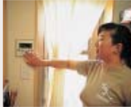
スイッチひとつでラクラク操作。お湯はりから保温・足し湯までおまかせ。

エコキュートを実際に使ってみていかがですか？「ガスだと蛇口をひねってからお湯が出るまで時間がかかりますよね。でも、エコキュートはお湯を貯めているから、すぐお湯が出てくる。冬場は特にうれしいですね」。使い勝手はどうですか？「フルオートタイプだから、お風呂はワ