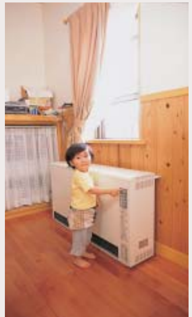
この蓄熱式電気暖房器1台で、リビングからキッチン、和室までぽかぽかに。火を使わないからお部屋の空気が汚れず、火傷も防げ、お子さんにも安心です。