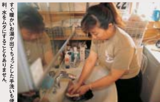
すぐ暖かいお湯が出てちよとした手洗いも便利水をムダにすることもありません。