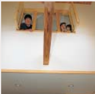
吹抜け上部の窓を開ければ、蓄熱式電気暖房器の暖かさが寝室までまわります。