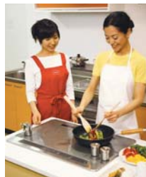
IH Studio (IH体験スタジオ)

IHキッチンヒーターを実際に使って みませんか。アドバイザーと一緒に、炒 め物と魚焼きなどが体験できます。