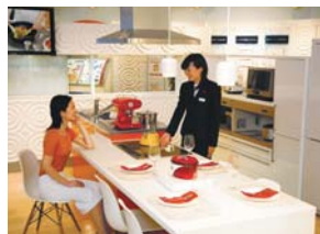
Life Style Laboratory (家電情報エリア)

リニューアルしたTEPCO銀座館は、 オール電化に関するさまざまな情報や設備がさらに充実しました。 IH体験スタジオなど、ご家族で楽しみながら、 オール電化に親しめます。ぜひお出かけください。