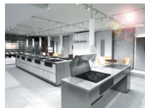
Switch! Station (オール電化情報エリア)

IHキッチンヒーターを実際に使って みませんか。アドバイザーと一緒に、炒 め物と魚焼きなどが体験できます。