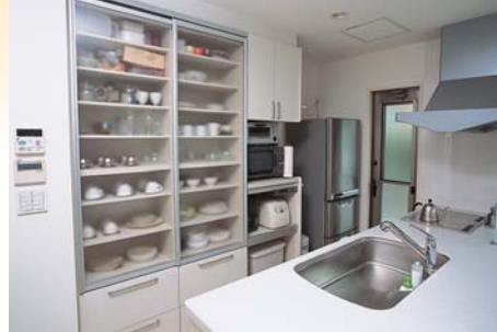
キッチン上部の吊り戸棚をなくしてすっきり。収納は後ろの壁一面で機能的に。