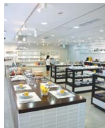
Switch! Shop by Flying Saucer

IHキッチンヒーターをはじめとして、 お客様のライフスタイルに合った家電 製品の選び方・使い方をご提案します。